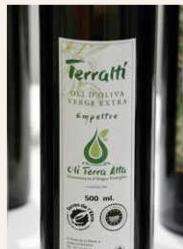
OLI DE L'EMPORDÀ * (ACEITE DEL EMPORDÀ)

LES GARRIGUES * SIURANA * OLI DE TERRA ALTA * (ACEITE DE TERRA ALTA) OLI DEL BAIX EBRE-MONTSIÀ * (ACEITE DEL BAIX EBRE-MONTSIÀ)