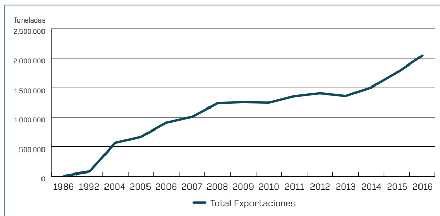
GRÁFICO 1 Evolución de las exportaciones españolas del sector porcino

granjas a esta normativa, cuyas exigencias se han extendido al resto de la cadena, desde el transporte y el sacrificio hasta la industria y la comercialización. Este esfuerzo tiene su recompensa, ya que garantiza que los productos españoles que llegan a cualquier mesa del mundo son seguros y de calidad, además de que se han producido respetando el medio ambiente y el bienestar de los animales.